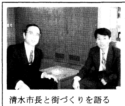
清水市長と街づくりを語る

市民の皆様と一緒に、かまがやのまちを“市民が主役”のまちに変えようと「ふじしろ政夫と共に市政を変える会」を発足させ、一步を歩み始めました。今年は統一地方選挙の年、“議会も変える”最大のチャンスの時がやってきます。清水市長を実現させた市民派の風をさらに大きく吹かせましょう。市民にとって素晴らしい年でありますよう、手を取り合っかまがやを変えていきましょう。