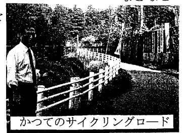
かつてのサイクリングロード