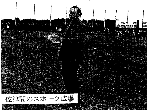
佐津間のスポーツ広場

昨年12月の会計検査院の調査で、県が県営住宅に購入した土地で事業が展開されていない場所が指摘されました。