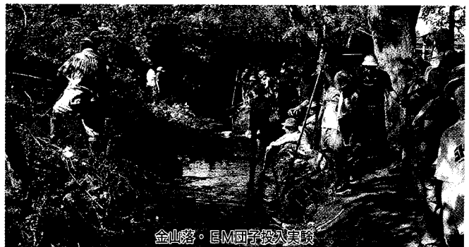
金峯路・EM団子投入実験

く地方自治体（鎌ヶ谷市）に伝えられていないとのこと。・パトリオットミサイル配備の問題点、・市民が反対していること、・そして地方自治体にも情報を提供すること、などを鎌ヶ谷市が防衛省に要請する必要がありますことを指摘しました。