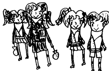
イラスト：山本江美子

って進学先を決めてきており、今年ついに「就学支援委員会」を廃止しました。ノーマライゼーションな社会が求められています。