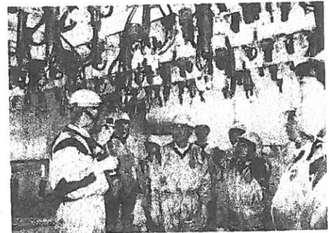
3号炉格納容器真下で